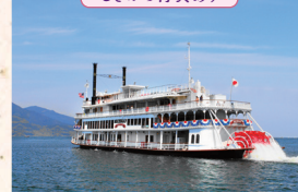
琵琶湖汽船(大津港)