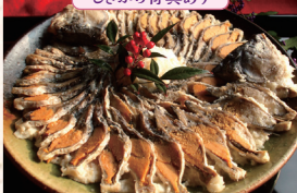
佃煮とふなずしの店 大家