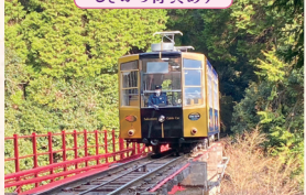
坂本ケーブル (ケーブル延暦寺駅)