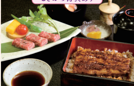
うなぎ料亭 山重 瀬田本店