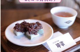
叶 匠壽庵 石山寺店