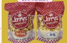
ジェリーズポップコーン 石山店