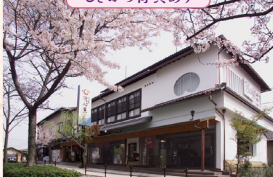
淡味の膳処 洗心寮