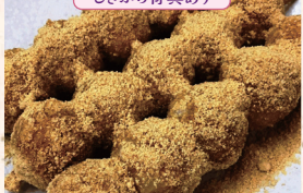
石山寺門前はたるの里