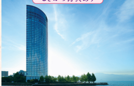
びわ湖大津プリンスホテル