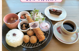
Café Restaurant Inti