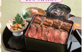
志じみ釜めし湖舟